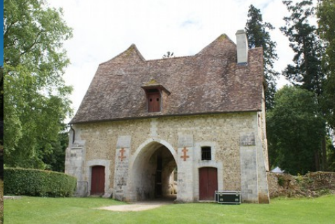
La châtelet d'entrée depuis la basse-cour