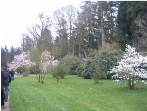
L'arboretum du château

Les avis seront cohérents avec ceux émis ces derniers années, à savoir : pas de maisons à volume compliqué (type V, W, Y, ou Z), pentes à 45° pour les volumes principaux, ardoise ou tuile plate de teinte brun vieilli, à 20u/m 2 , avec un débord de toiture de 20cm, enduit de teinte beige clair avec modénatures (au choix : chaînages, encadrement de fenêtres, soubassement, colombage...). *Voir les autres fiches.