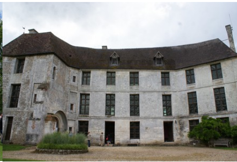
La façade Ouest remaniée fin XVII e