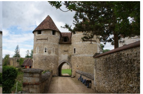
Le châtelet d'entrée de l'extérieur