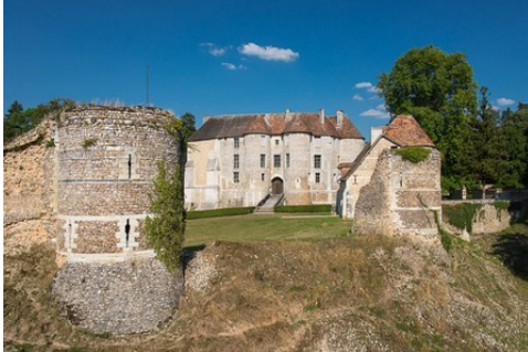
Les vestiges de l'enceinte