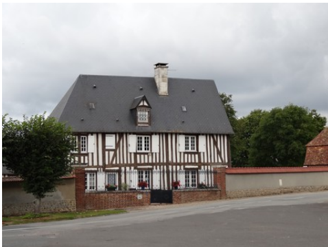
Quelques maisons dans les abords