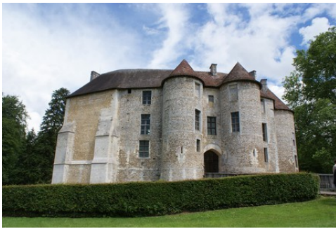
La façade Est du logis