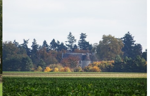
Le château vu de la Croix Poussin

Pour la zone en rose foncé dans le périmètre de 500m